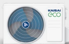
Jednostka zewnętrzna KEX